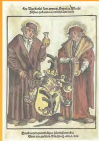
Lucas Cranach (D), kolorierter Holzschnitt, um 1509