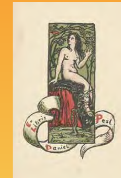
Franz Marc (D), Lithografie, 1905