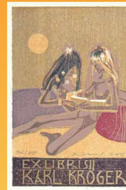
Frank Eißner (D), Farbholzschnitt (verlorene Form), 2013