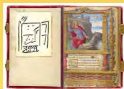
Pablo Picasso, Holzschnitt, ca. 1935

So signalisieren bisweilen bereits Papierstärke und Format (bis DIN A4 und größer) die angestrebte Unabhängigkeit vom Buch. Solche Sammler-Exlibris nähern sich der freien Grafik an. Künstler und Auftraggeber sind dabei keine Grenzen gesetzt. Alle Spielarten der Drucktechnik kommen zur Verwendung, vom Kupferstich bis zum CGD (Computer generated design).