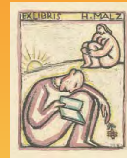
Michel Fingesten (A,D), Lithografie, um 1920