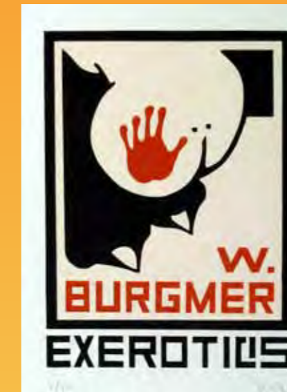
Axel Vater (D), Linolschnitt, 2000