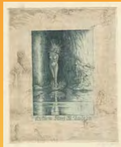
Emil Ebner (D), Farbradierung, 1922