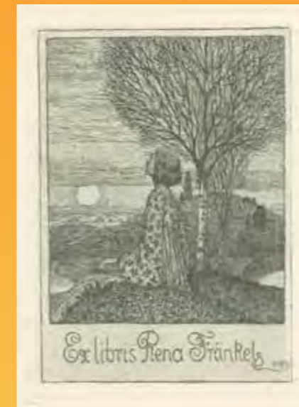
Heinrich Vogeler (D), Radierung, 1912